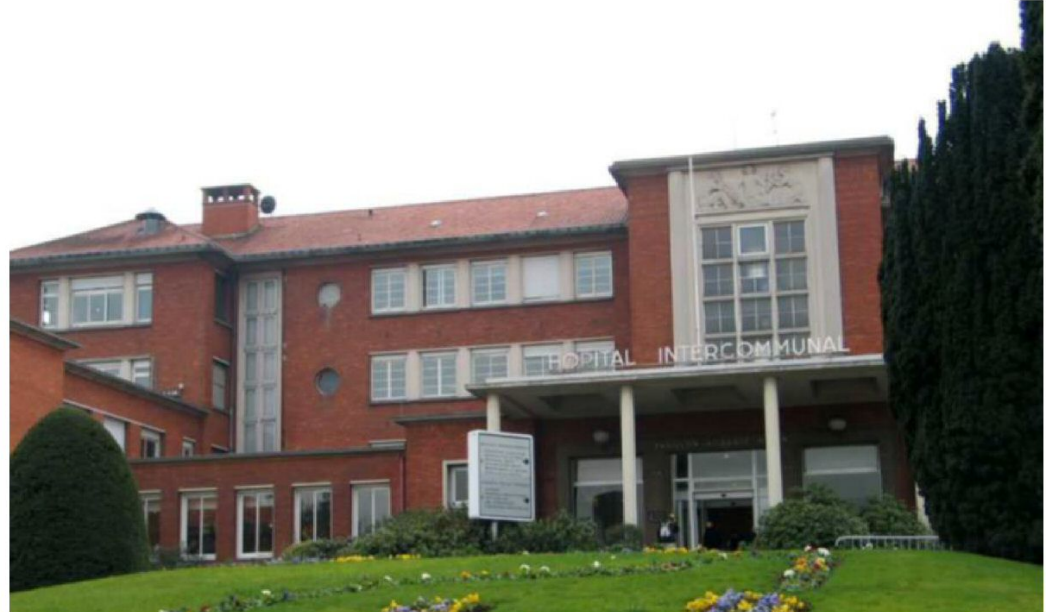
Créteil. L'hôpital intercommunal est le premier établissement public à utiliser ce système. Il devrait bientôt aller plus loin avec la mise en ligne des comptes-rendus d'hospitalisation. (L.P.)

Fondée voilà quatre ans, installée dans l'incubateur Cochin à Paris, Apicéa a déjà développé le wi-fi pour les patients dans 120 hôpitaux en France. « Nous avons voulu apporter un outil simple pour améliorer le